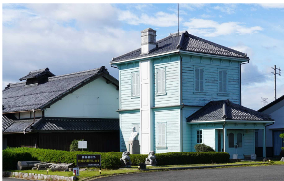
東近江市のガリ版伝承館（旧堀井邸）