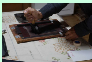
ガリ版体験

所在地：滋賀県東近江市蒲生岡本町663 開館時間：午前10時～午後4時30分（入場無料） 開館日：土、日曜日のみ ガリ版体験：事前予約・有料： がりばん楽校（ガリ版伝承館向かい） 連絡先 TEL090-3268-3134 アクセス：JR琵琶湖線「近江八幡駅」下車南口から、 近江鉄道バス日八線「ガリ版伝承館」バス停下車