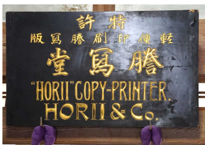
特許を宣伝する堀井謄写堂の看板