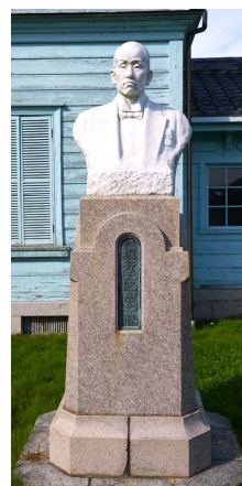
堀井新治郎（元紀）胸像