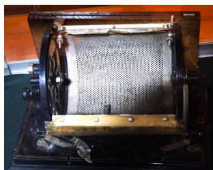
堀井輪転謄写印刷機