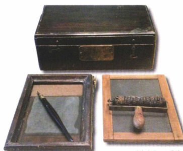
堀井謄写版 1 号機