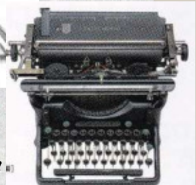
英文タイプライター 菊武学園蔵