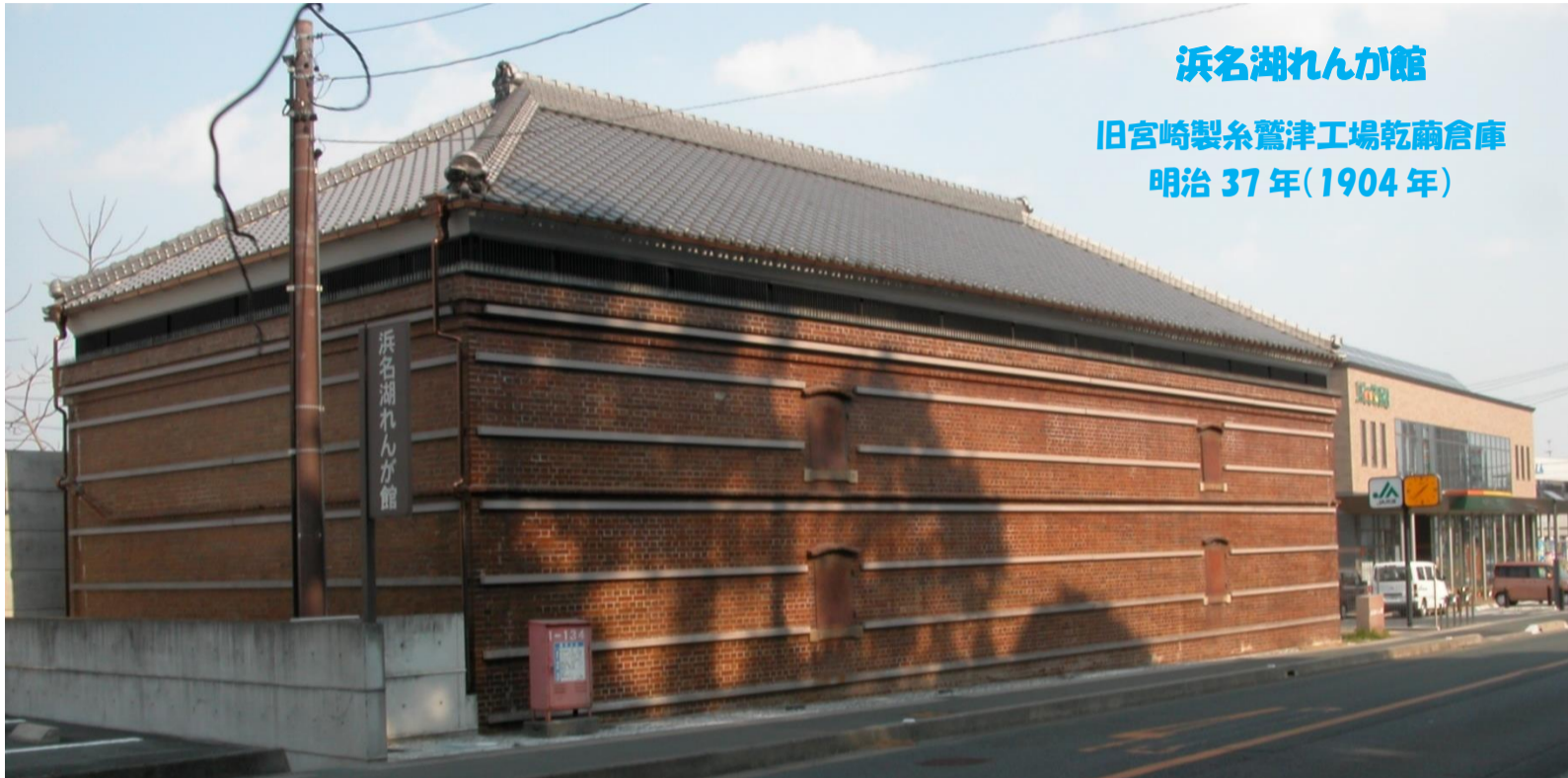
浜名湖れんが館 旧宮崎製糸鷺津工場乾繭倉庫 明治37年(1904年)

JR 東海道線鷺津駅から西に 500m程の国道 301 号線沿いにその建物はある。現在は湖西市が管理する浜名湖れんが館としてコンサートや各種の催し物の会場として利用されている。元々この建物は明治 37 年(1904 年)に宮崎製糸鷺津工場の乾繭倉庫として建てられたものである。