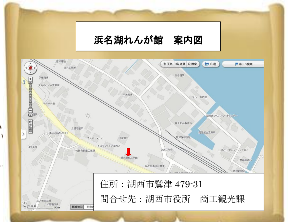
浜名湖れんが館 案内図