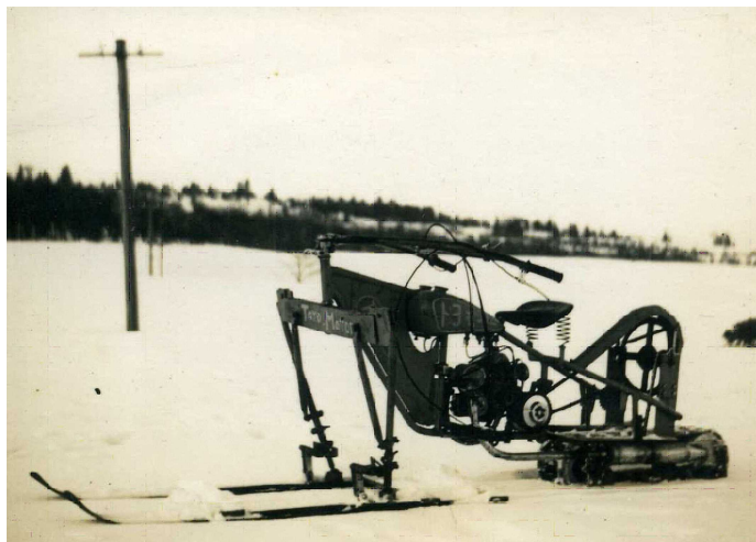
トヨタモーター雪上バイク試作車（1951）